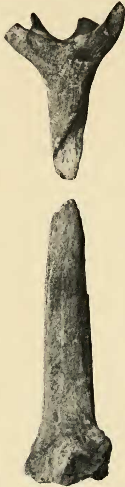
Abb. 2: Lagomeryx parvulus (ROGER), rechtes Geweih von innen, obermiozäne Spaltenfüllung Attenfeld (Slg. München 1915 V 24). \times 1,5 .

Auch eine nähere Beziehung zu den von DEHM (1944: 82) neu beschriebenen Resten aus der Spaltenfüllung Solnhofen, deren Zugehörigkeit zu Lagomeryx wegen der fehlenden oberen Teile fraglich ist, kommt angesichts der größeren Maße der Stangen nicht in Betracht.